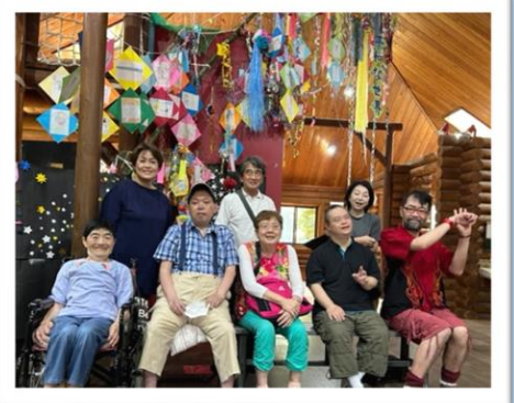
今年もご利用さんが受注で作った七夕飾りを見学 片瀬子どもの家