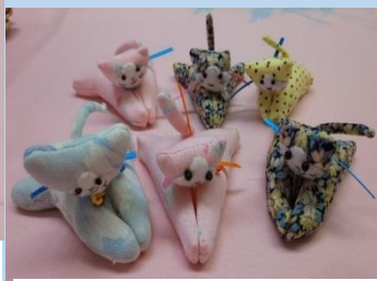
かわいらしい猫のクリップは愛嬌たっぷり