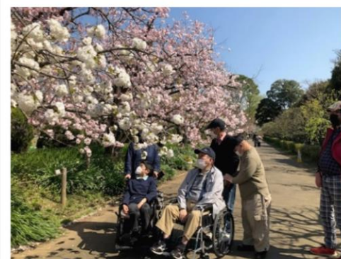
お花見 大船フラワーセンター