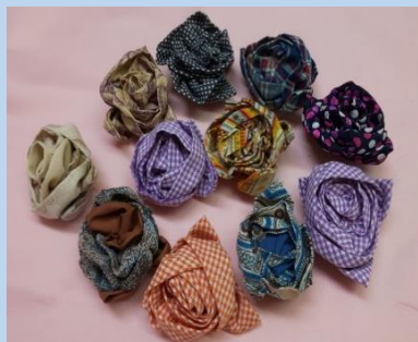
布のブローチはコサージュとしてもスカーフやマフラー留めにしても素敵