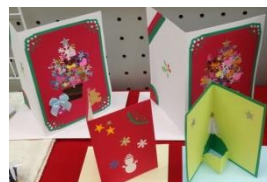
手作りクリスマスカード