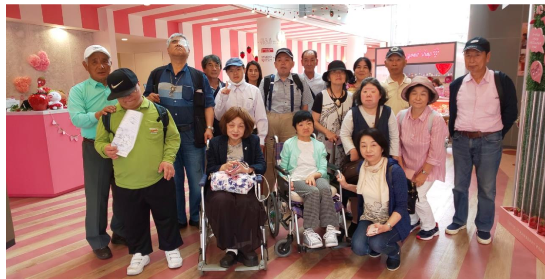
東京ストロベリーパーク 5月28日 バス旅行にて