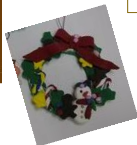
クリスマスミニリース